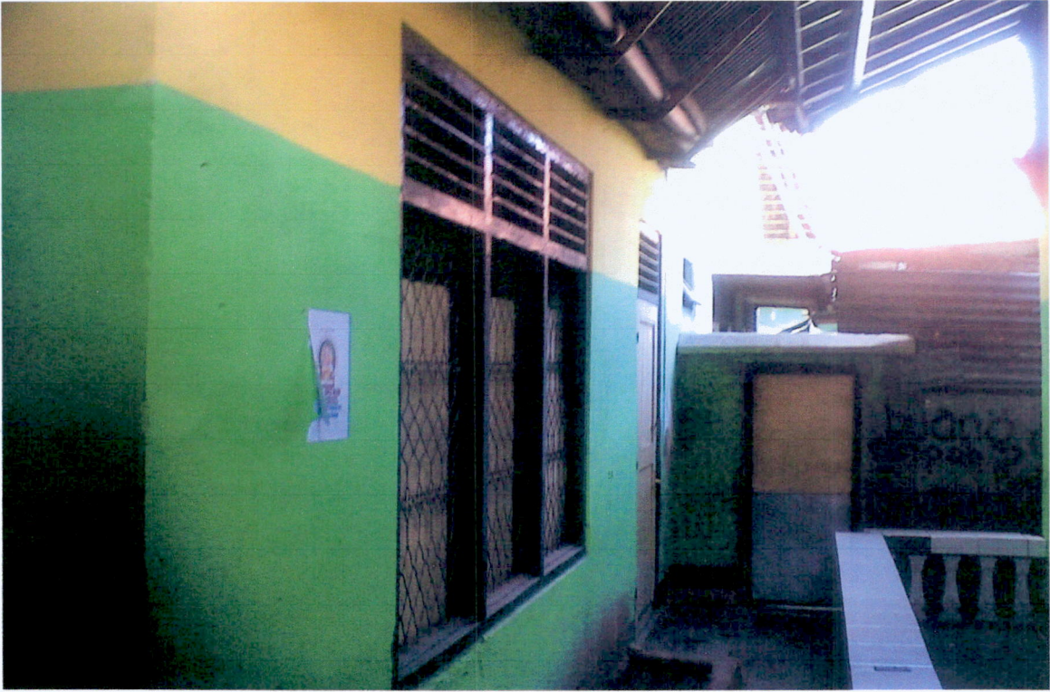
TANPAK BAGIAN BELAKANG