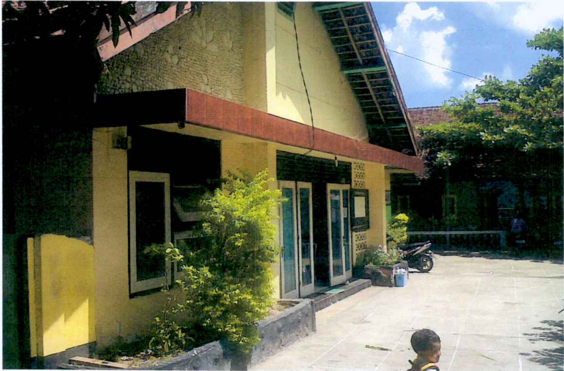
TANPAK BAGIAN DEPAN