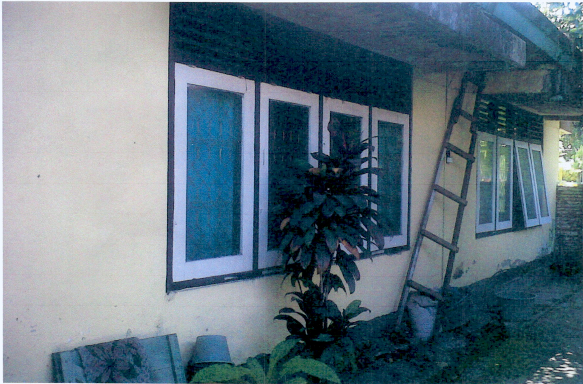
TANPAK BAGIAN UTARA